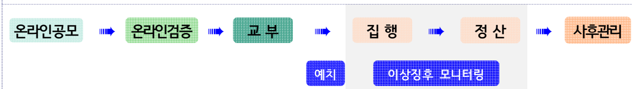
<지방보조금관리시스템 프로세스 개념도>