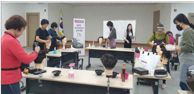
양촌면 평생학습센터 <이미용봉사자교육>

※ 지역별 평생학습매너저 선정·배치, 운영위원회 개최, 프로그램 개발·운영 등