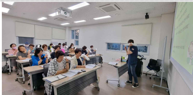
시민기본 소양교육 등