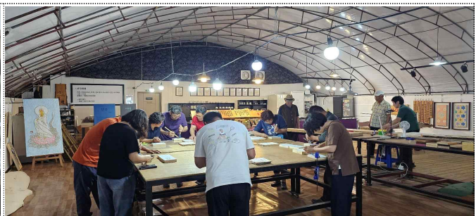
심암2리 마을배움터 <한마음서각교실>