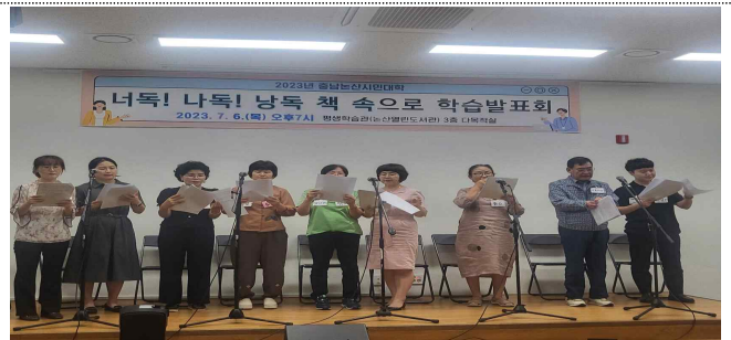
학습발표회 및 직업능력개발 연계