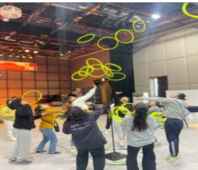
장애인 가족 힐링캠프