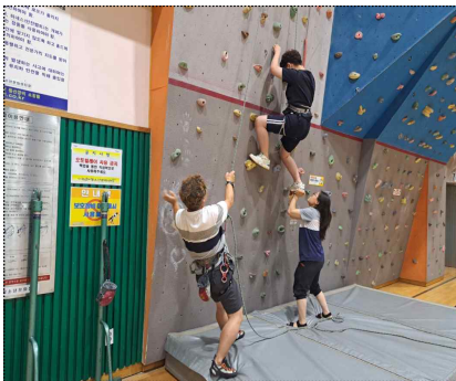
장애 유형별 맞춤 평생교육